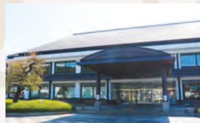
安中市役所松井田支所