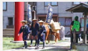
9月23日、24日 佐渡市開催の様子

かつて佐渡金銀山で産出された金銀は、北国街道から中山道を通して江戸に運ばれました。松井田を出発し、史跡を巡りながら安中宿を目指すコースです。