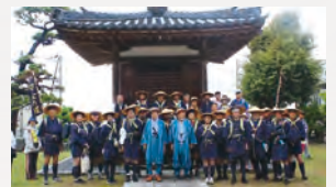
10月1日 出雲崎町開催の様子